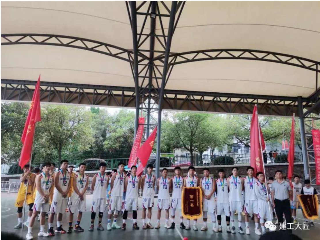
学院篮球比赛荣获男子篮球队第一名